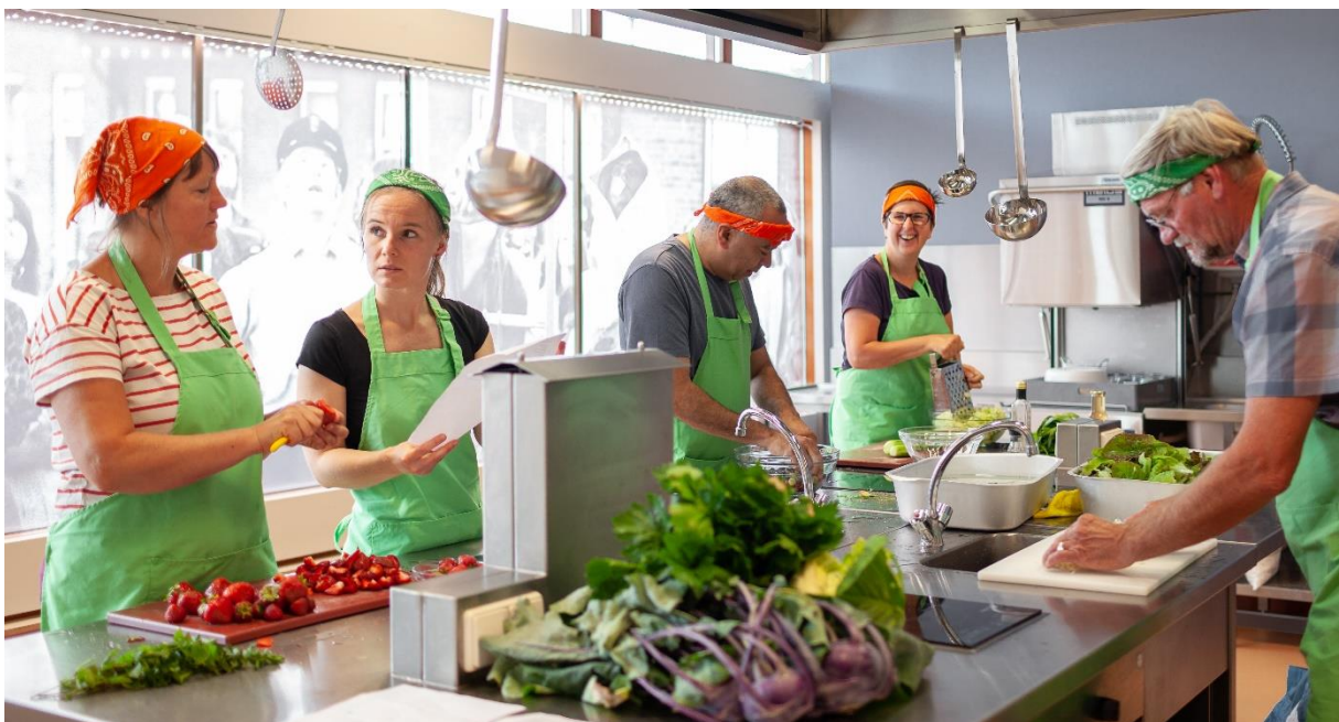
Kookgroep in de keuken van Buurtrestaurant 't Hert

Van Tuin Tot Bord is actief in drie stadsdelen, namelijk Nijmegen Midden, Lindenholt en Nijmegen Zuid. In elk stadsdeel is een buurtmoestuin en een wekelijks buurtrestaurant.